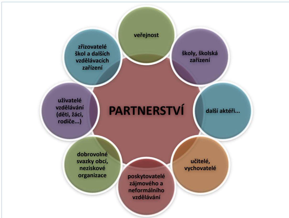
Složení Partnerství MAP

Struktura a konkrétní složení partnerství je předmětem dohody relevantních aktérů v řešeném území. Partnerství stojí na potřebě rozvíjet ve školách motivující kulturu, zaměřenou na maximální úspěch každého žáka a učitele a rovněž na prospěšnosti a účelnosti naplňování lokální vize vzdělávání pro území ORP Děčín. Cílem vytvořeného partnerství je společná snaha o zlepšení kvality a pozitivní ovlivnění oblasti včasné péče, předškolního a základního vzdělávání s tím, že bude podpořena spolupráce mezi všemi aktéry ve vzdělávání, tzn. všemi, kteří jsou přesvědčeni o nutnosti a prospěšnosti zvýšení úrovně vzdělávací soustavy s ohledem na místně specifické problémy a potřeby řešeného území.